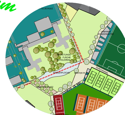
Grünraum zwischen CAMPAGNE-REITER-AREAL und SCHULCAMPUS der NMS-Reichenau

Dank an alle Lehrpersonen und der Direktion der NMS-Reichenau, der Stadtplanung Innsbruck, der IIG und allen beteiligten ArchitektInnen und ArchitekturvermittlerInnen